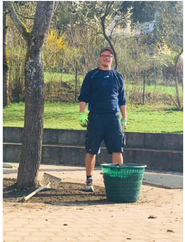
Unser Rondell von Schlamm und Schmutz befreit!

Vielen, vielen Dank an alle Helfer. Es hat ja an diesem sonnigen Tag nur so „gewimmelt“☺ und so schnell fertig waren wir noch nie!