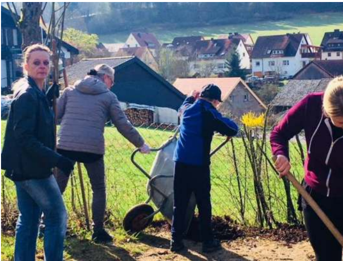
Rindenmulch im Garten verteilt!

Vielen, vielen Dank an alle Helfer. Es hat ja an diesem sonnigen Tag nur so „gewimmelt“☺ und so schnell fertig waren wir noch nie!